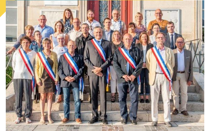
Membres commission Finances